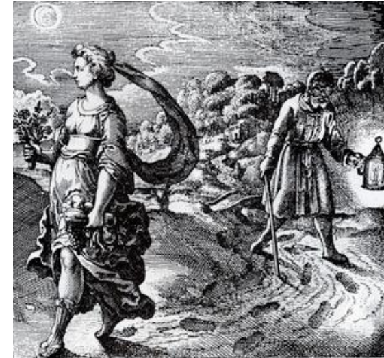
L'alchimista segue le orme della Natura, da Atalanta Fugiens di M. Maier , 1618

Il giardino alchemico rimane chiuso per chi non ha i piedi per camminare e seguire le orme della Natura